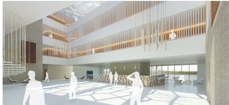
Konzeptvisualisierung für ein Designhotel, CACTUS Architekten, Koblenz/Stuttgart

Allplan Intelligente BauDaten (IBD) sind die ideale Ergänzung für die BIM-Software Allplan und dienen der Prozessoptimierung. Erstellen Sie Ihren Grundriss oder ihr Gebäudemodell mit Hilfe vordefinierter Bauteile, die IBD-Assistenten, einfach und effizient. Sie erhalten nicht nur ansprechende Präsentationsunterlagen und Gebäudemodelle, sondern können mit den IBD Planungsdaten auch Wohnflächen- und Bruttorauminhaltsberechnungen durchführen.